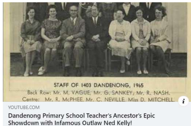
Dandenong Primary School Teacher's Ancestor's Epic Showdown with Infamous Outlaw Ned Kelly!

https://youtu.be/B_XNfVKeiw?si=AUX1LXDxXMwHdCx